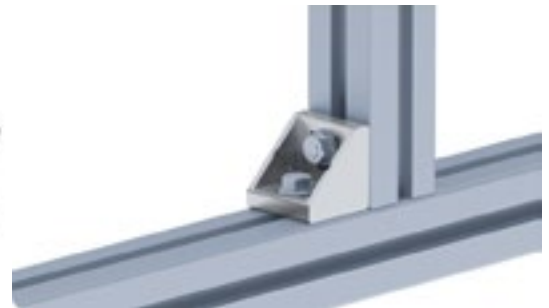
Aluwinkel 45 T Alu Connection Angle 45 T